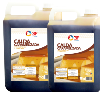
11786 3F CALDA PARA PUDIM CARAMELO 7 KG