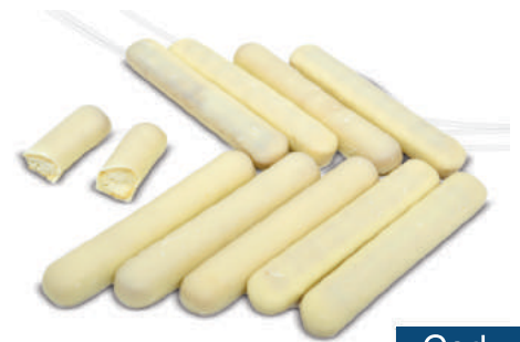
BISCOITO FINO 3F PALITO DE CHOC 2KG