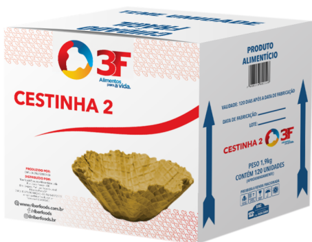
8184 CESTINHA 3F PRO II 1,9 KG Aprox. 120 UN