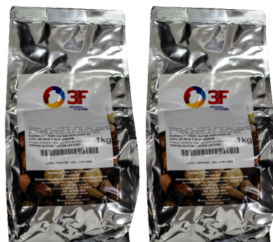
10237 3F PÓ CHANTILLY CONFEITEIRO 1 KG 10033 3F PÓ CHANTILLY CONFEITEIRO 10 KG 8223 3F PÓ CHANTILLY ICETOPPING 1 KG 8222 3F PÓ CHANTILLY ICETOPPING 10 KG

TEMOS TODAS AS SOLUÇÕES PARA Confeitaria