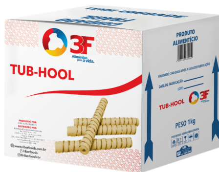
8181 CANUDO BISC 3F PRO 1 KG