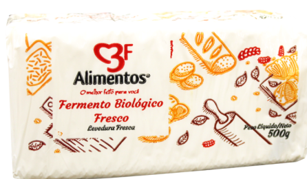
12127 FERMENTO FRESCO BIOLÓGICO 3F 500 G