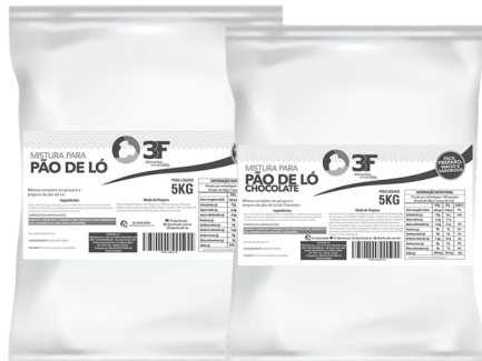
14272 MISTURA PÃO DE LO 3F 5 KG 14073 MISTURA PÃO DE LO CHOCOLATE 3F 5 KG