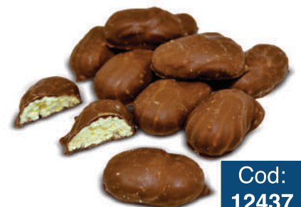
BISCOITO FINO 3F PÃO DE MEL PRETO 2KG