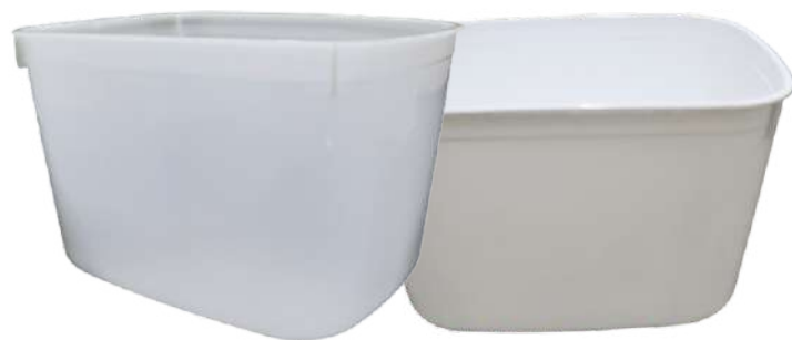
14067 POTE 3F RET 2L BRANCO 25 UN 14068 POTE 3F RET 2L NATURAL 25 UN