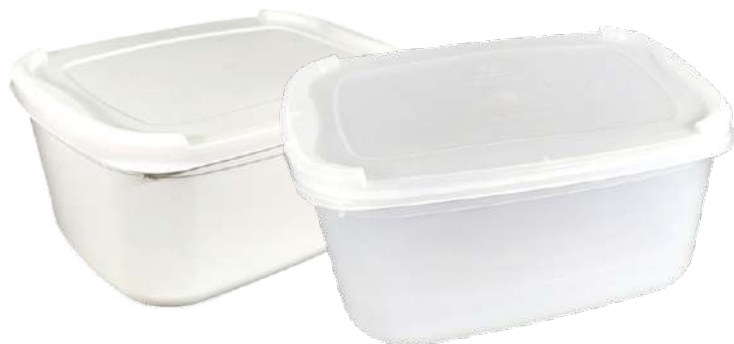
14065 POTE 3F RET 1,5L BRANCO C/T 200 UN 14066 POTE 3F RET 1,5L NATURAL C/T 200 UN