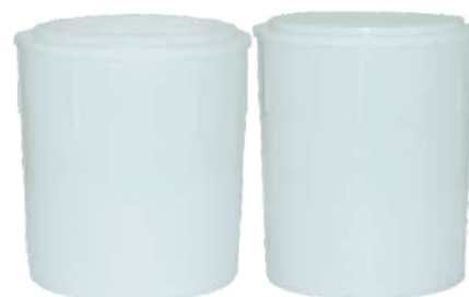
3459 BALDE SORV 10 LT RED C/TP S/ALCA PADRÃO 3461 BALDE SORV 12 LT RED C/TP S/ALCA PADRÃO