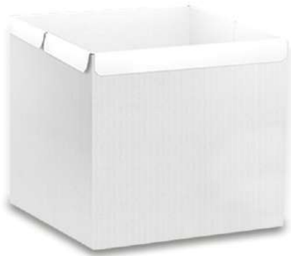
3425 CAIXA SORVETE BRANCA 10 LT JS PACK 50UN 3427 CAIXA SORVETE BRANCA 5 LT JS PACK 50UN