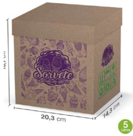
12046 CAIXA SORV PARDA 5L VIVA BOX 70UN