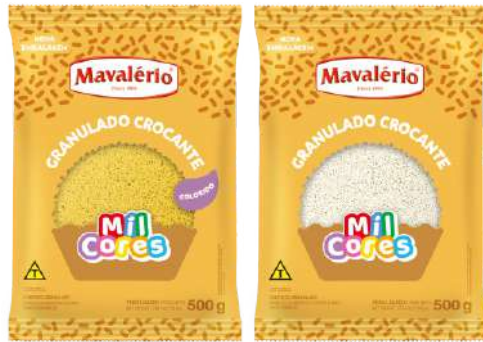
2087 GRAN CROC BRANCO MAVALERIO 500 G 4935 GRAN CROC AMARELO MAVALERIO 500 G