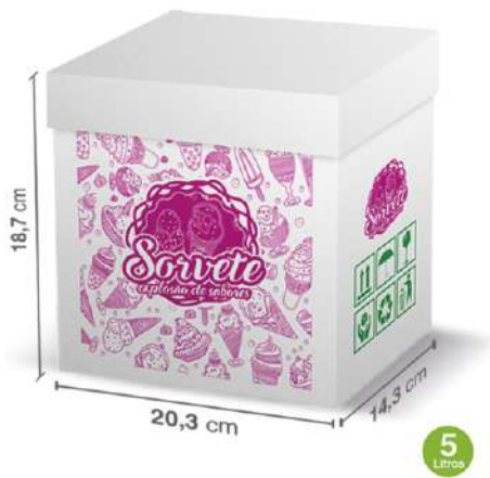
12045 CAIXA SORV BRANCA 5L VIVA IN BOX 70UN