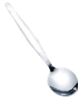
4601 COLHER VIEL PARA SOBREMESA INOX 12 UN