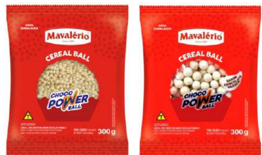
10783 FLOCOS MINI BALL BRANCO MAVAL 300 G 14539 FLOCOS POWER BALL CHOC BRANCO MAVAL 300 G