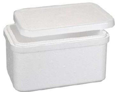
1992 ISOPOR 2,0 KG QUAD STYROCORTE 48UN