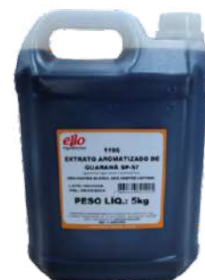
12395 EXTRATO AROM GUARANA ELLO SP-57 5 KG