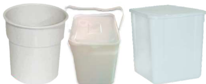
3454 BALDE COSTAFRIO CONCHA SORV POLICARBONAT 3455 BALDE SORV 10L C/TP ALCA QUAD ILHAPLAST 3457 BALDE SORV 10 LT C/TAMPA QUADR PADRAO