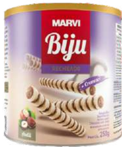
13035 CANUDO BISC RECHEADO CHOC/AV MARVI 250 G