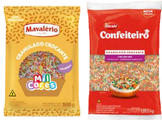
2088 GRAN CROC COLORIDO MAVALERIO 500 G 7465 GRAN CROC COLORIDO CONF HARALD 1,05 KG