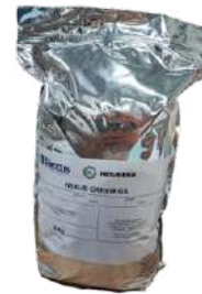
14327 ESTABILIZANTE CREAM GS HEXUS 5 KG