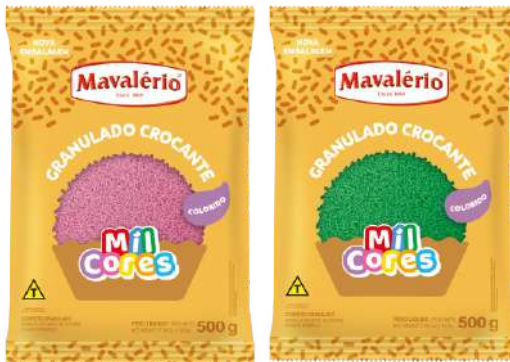
4938 GRAN CROC ROSA MAVALERIO 500 G 4939 GRAN CROC VERDE MAVALERIO 500 G