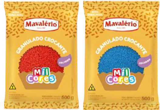
4936 GRAN CROC VERMELHO MAVALERIO 500 G 4937 GRAN CROC AZUL MAVALERIO 500 G