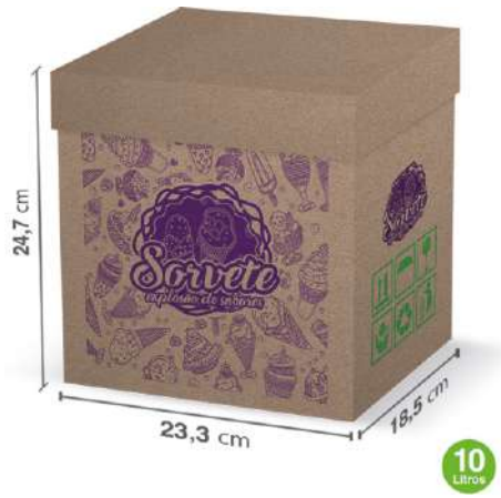
12044 CAIXA SORV PARDA 10L VIVA BOX 70UN