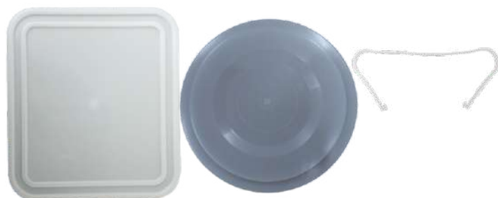
3448 TAMPA BALDE 10 LT QUADR ILHAPLAST 3450 TAMPA BALDE 10/12LT REDONDO PADRÃO 3451 ALÇA P/ BALDE SORV ILHAPLAST