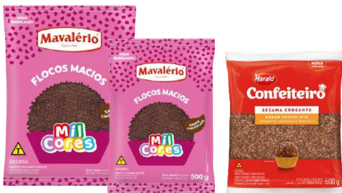
6079 ESCAMA CHOCOLATE MAVALERIO 500 G 14538 ESCAMA CHOCOLATE BRANCO MAVALERIO 500 G 11393 ESCAMA CHOCOLATE MAVALERIO 2,5 KG 10635 ESCAMA CHOCOLATE CROC HARALD 500 G