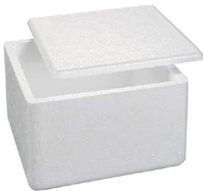
1990 ISOPOR 500G STYROCORTE 50UN 1991 ISOPOR 1,0 KG STYROCORTE 30UN