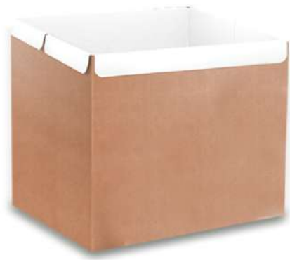
3426 CAIXA SORVETE PARDA 10 LT JS PACK 50UN 3428 CAIXA SORVETE PARDA 5 LT JS PACK 50UN