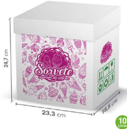
12043 CAIXA SORV BRANCA 10L VIVA BOX 70UN