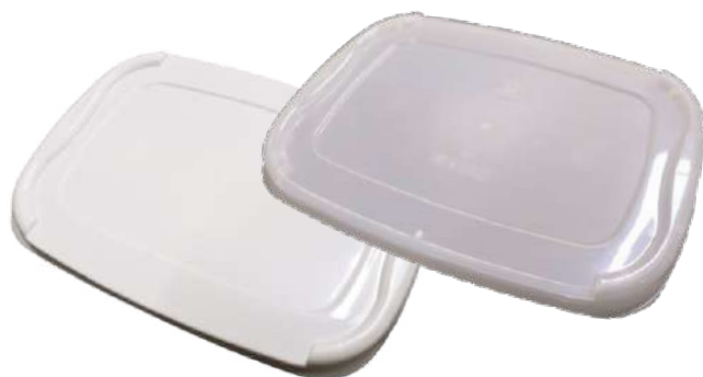
14381 TAMPA 3F RET BRANCA 1,5/2L 25 UN 14382 TAMPA 3F RET NATURAL 1,5/2L 25 UN